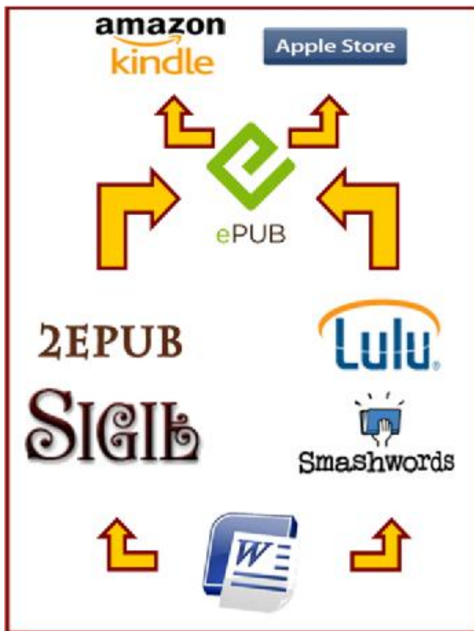
Fig. 1: Il-proċess, minn dokument Word għall-bejgħ fuq l-internet.